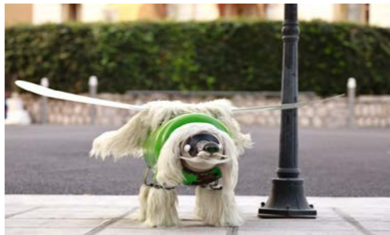
Le connectif Keskon Fabrique - Le K-niche, hommage à Dalí, 2013 Bonbonne métallique, aluminium, fourrure synthétique, pales de ventilateur, grillage, caoutchouc 55 cm x 106 cm x 114 cm