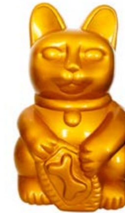
Le chat d'or par METCUC

S'y rendre : Galeries Lafayette de Nice Masséna – RDC à côté du rayon parfumerie – entrée à l'angle de la rue Gioffredo et de la rue Sacha Guitry