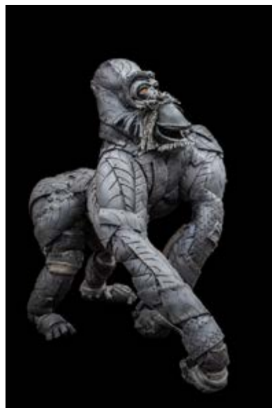
FG Fine Art - Artiste Serge Van De Put - Le Gorille - matériau pneu