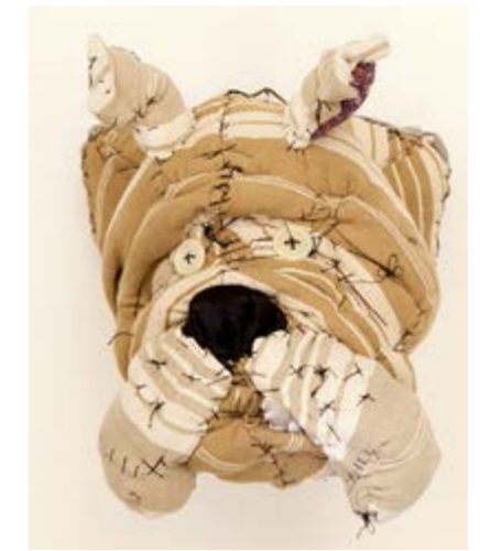
Atelier 5 à Nice - Anne Valérie DUPOND - les animaux en textile