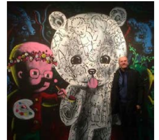
Patrick Moya - Peinture chat Kawaiï