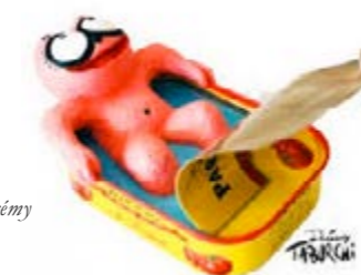
La Chardine de Nice - Souvenir niçois par l'artiste Jérémy TABURCHI

Kristian est né à Grenoble en 1960. Son premier dessin paraît en 1981 dans le Dauphiné Libéré. Aujourd'hui ses dessins d'humour et d'actualité qui ont fait l'objet de plus de 12 000 publications en France et à l'étranger, sont publiés dans la presse et la télévision. Il réalise également des affiches, des dessins publicitaires.