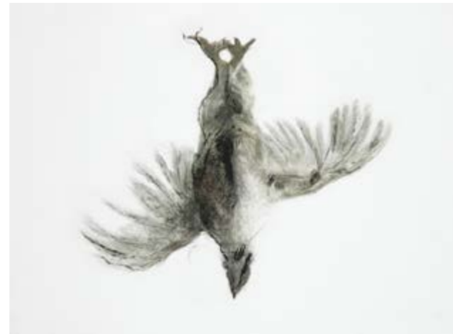
Emmanuelle Mason - Grvure "la poule", série des natures mortes - 30X40 cm Pointe sèche sur estampe numérique papier coton 320g