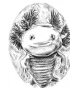
Christophe Pelardy - "AXOLOTL." - format 10 / 20 cm dessins au crayons, 2011.